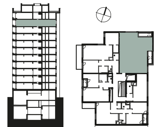
SCHÉMATICKÉ ZNÁZORNĚNÍ BYTOVÉHO DOMU